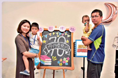
圖書館闖關遊戲 完賽合照